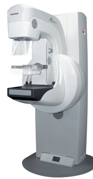
Mamògraf digital directe de camp complet.

Aquest mamògraf a més de major rapidesa en l'estudi té com a característica millorar la confortabilitat de la pacient gràcies a un disseny més ergonòmic. Sabem que la incomoditat que ocasiona la compressió en la mamografia fa que algunes dones rebutgin o retardin aquesta prova implicant l'aprofitar-se de la possibilitat d'un diagnòstic més precoç i un tractament menys agressiu en cas d'aparèixer una lesió.